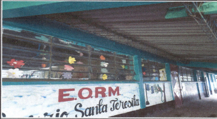
Foto1: Fabricación e instalacion de balcones de hierro en ventanas.